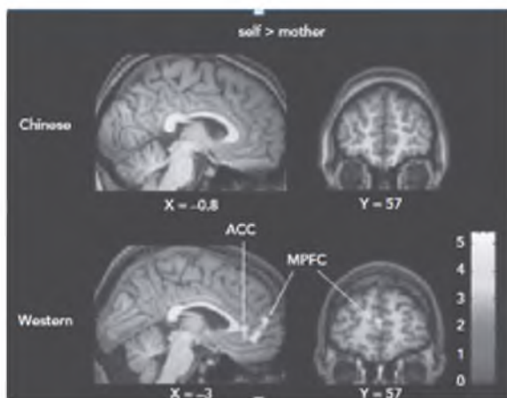
Рис. 3. Влияние культуры на нейронную репрезентацию самости при размышлении о об отношении привязанности к матери у представителей западной (индивидуалистической) и китайской (коллективистской) культур. Приводится по: 27, с. 1807.

Приобретшие в последние годы особую популярность кросс-культурные исследования активности мозга, связанные с использованием возможностей компьютерной томографии и внедрением возможностей техники нейровизуализации, выявили существенные различия между европейской и восточно-азиатской культурами.